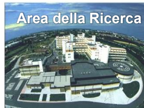
Area della Ricerca